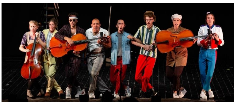
Cellokrijgers, Milaan 2019

Cellostorm (5+) is een klassieker die sinds de première in 2012 onafgebroken speelt en als baanbrekend te boek staat in de sector. Met Cellokrijgers (6+) heeft het Octet het in 2018 klaargespeeld om er een tweede klassieker naast te zetten. Deze onderscheidt zich zo van Cellostorm, dat voortdurend naar beide familievoorstellingen veel vraag is, ook internationaal.