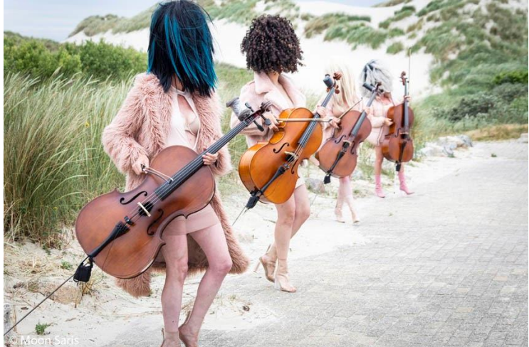
Instant Love op Oerol 2018

We realiseren deze artistieke ambities door samen met makers te zoeken naar nieuwe interdisciplinaire vormen. Het Octet heeft deze coproducties geïnitieerd en neemt nog meer dan voorheen eigen artistieke verantwoordelijkheid, opdat onze visie en oorspronkelijkheid tot uitdrukking komen. Wij werken samen met de gekozen partners om drie redenen: zij erkennen de muziek en de ijzersterke fysiek-theatrale rol van het Octet als de drijvende krachten van de voorstelling, zij omarmen onze werkwijze (een gezamenlijk creatief proces van de cellisten en andere makers) en zij brengen ons buiten onze eigen comfortzone.