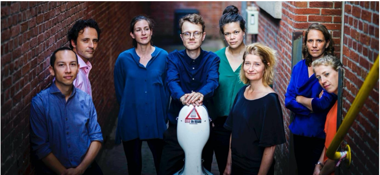
Cello Octet Amsterdam 2020

Amsterdam biedt ruimte voor experiment, innovatie en verbinding. Cello Octet Amsterdam voelt zich hier thuis als ontdekkingsreiziger in de muziek en de podiumkunsten. Het is de ideale (uitvals)basis voor een internationale, grensverleggende concertpraktijk.