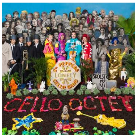
Sgt. Pepper's Lonely Cello Band

Frits van der Waa 27 oktober 2020, 11:13