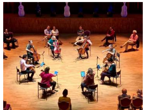
Balkonscène: eerste concert na 13 weken quarantaine