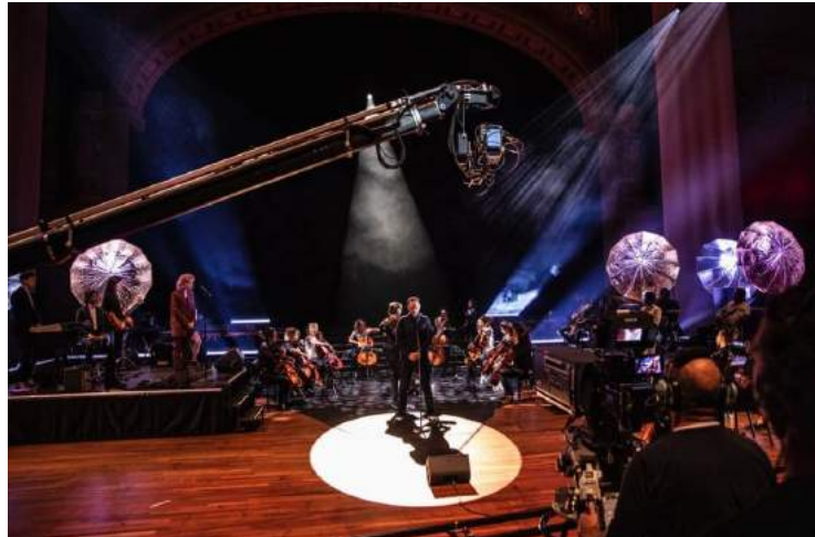
Torre Florim & het Cello Octet tijdens Wende's Kaleidoscoop in Carré