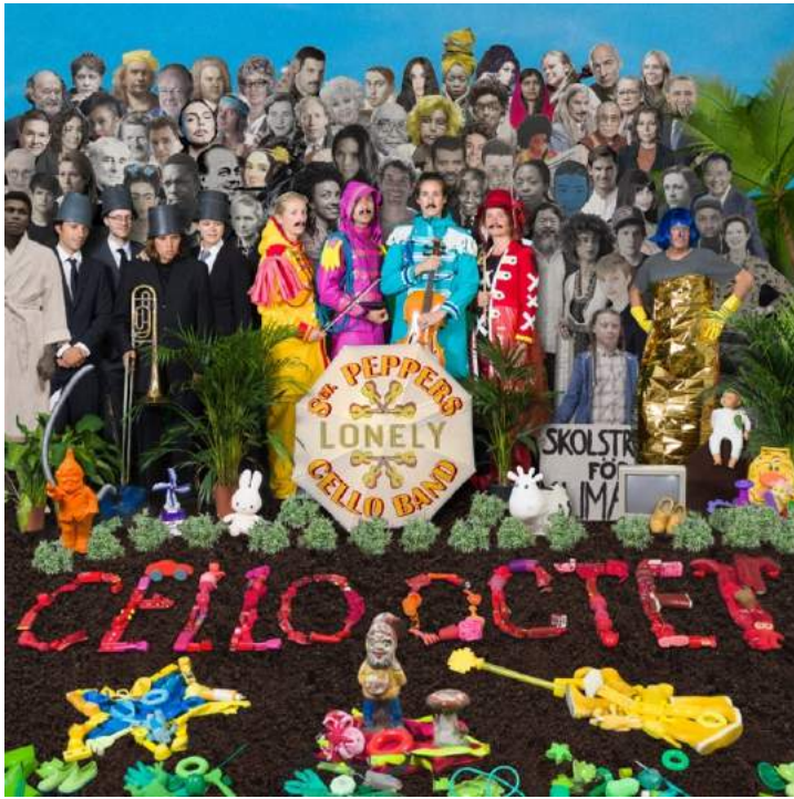
Onze versie van de beroemde albumcover. bewerking: Titus Tiel Groenestege, vormgeving: Dieuweke van Reij.

"Maar het is natuurlijk de – compleet uit het hoofd gespeelde – muziek die maakt dat we dit gerust het concert van het jaar kunnen noemen." ★★★★★ Frits van der Waa in de Volkskrant.